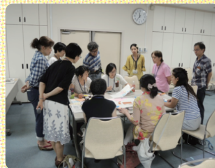
ワークショップ「子どもにやさしい空間」の様子