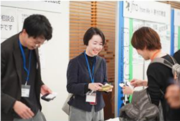
参考:FRJスペシャルの様子